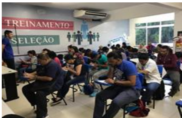
Seleção de Trabalhadores

Além dos serviços acima realizados nas unidades do Sine/Manaus, realizamos atendimentos externos em comunidades, bairros e escolas da cidade de Manaus. No ano corrente, portanto, totalizamos 126 ações realizadas e 3.264 pessoas atendidas.