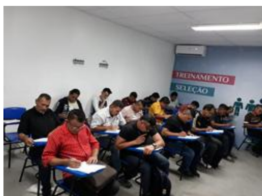
Encaminhamento de Trabalhadores